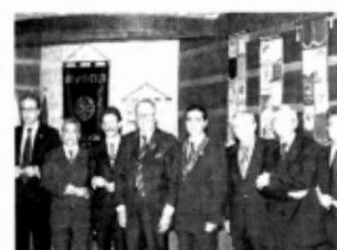
Il direttivo del Rotary di Augusta.